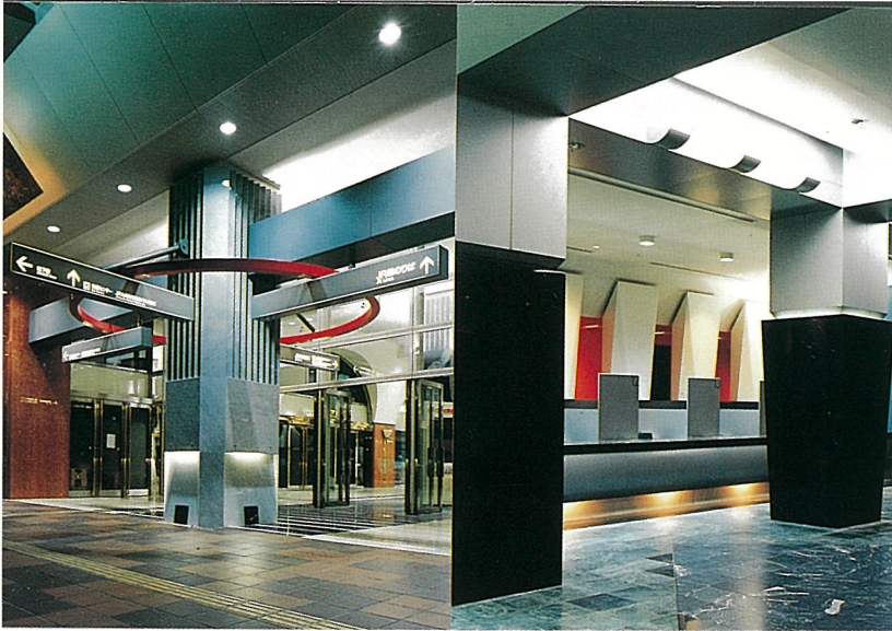
日類 ● 博多駅コンコースサイン